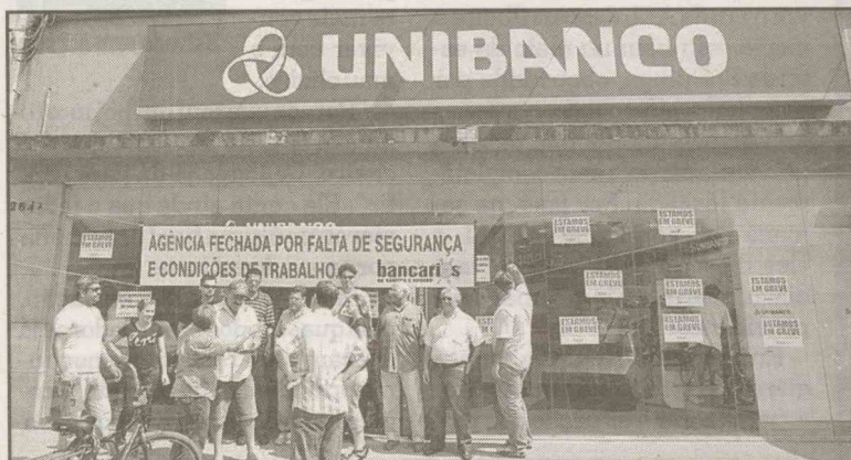
O sindicato organizou um piquete na porta da agência e interrompeu o serviço

Big afirmou que a paralisação faz parte da campanha salarial 2009/2010, e que a direção do banco teria se comprometido a colocar