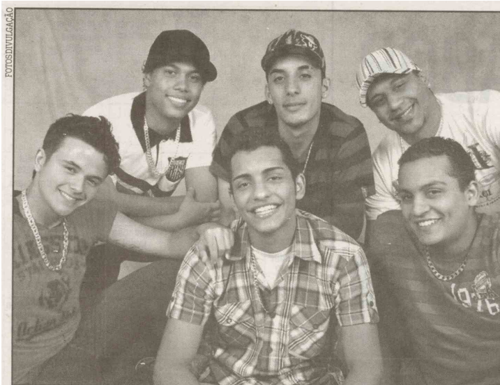
Os músicos, que têm agenda cheia neste mês, também abrem show para o Sorriso Maroto em VC